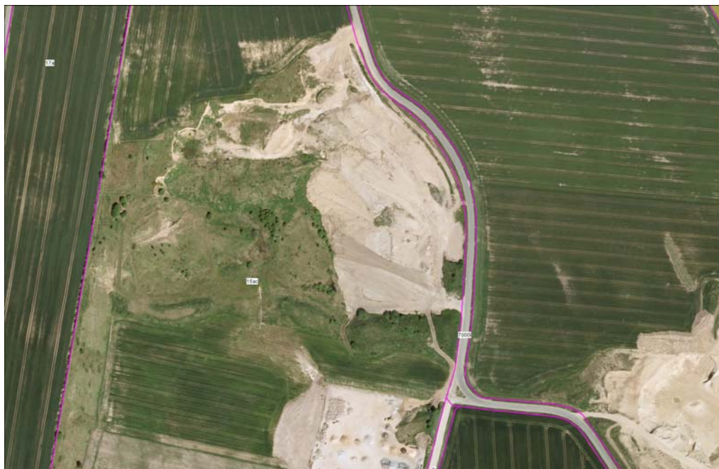
Matr.nr. 15ac Stjær By, Stjær

Jorden skal anvendes til efterbehandling i overensstemmelse med den gældende efterbehandlingsplan.