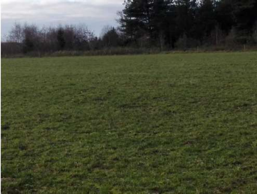
Billede 1. Marken på matr. nr. 5f Havris Tvis