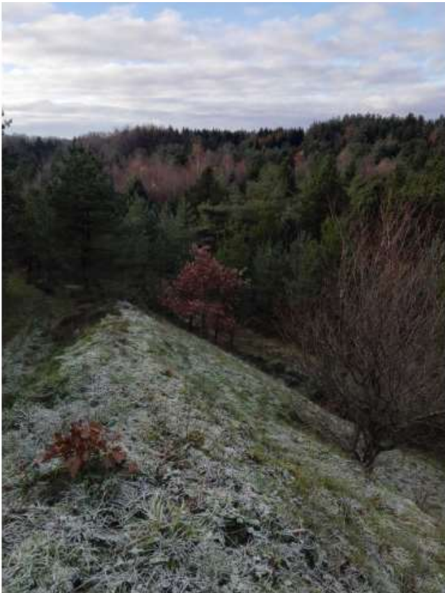
Billede 2. Tidligere råstofgravningsområde på et naboareal