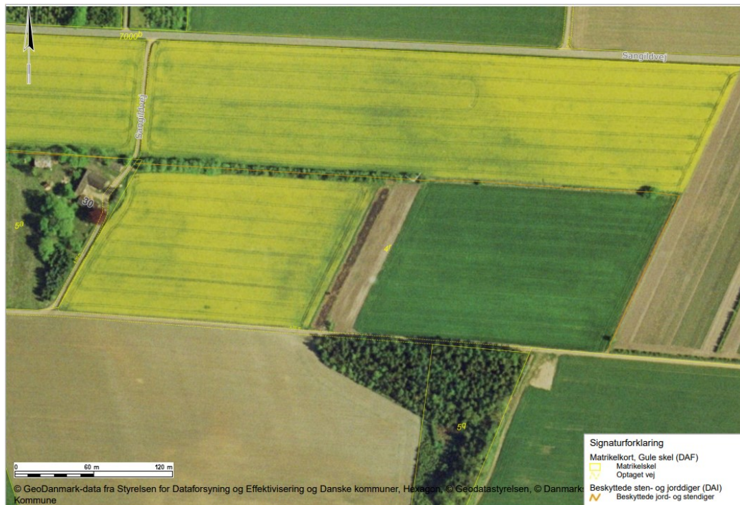
Øverst: Luftfoto 2021, hvor diget (D.00.118.615) er væk. Nederst: Luftfoto 1999, hvor diget fremstår.