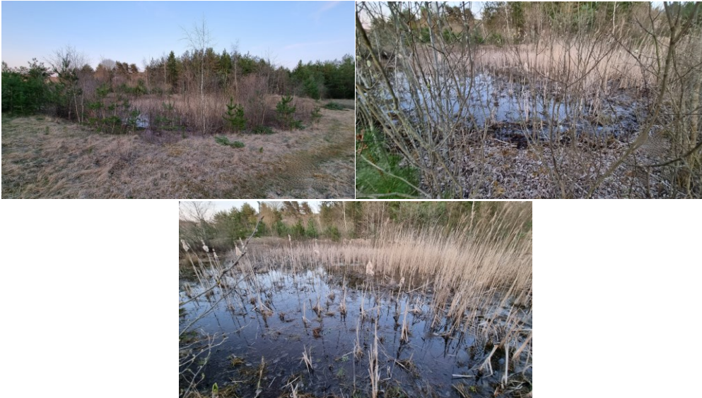
Billede 4: Undersøgelsesområde 2.

§ 3-beskyttet paddeskrab. Var under tilgroning af sivgræs i selve søen samt af birk, pil og fyr omkring søen. Søen havde en dybde på max 0,5 m, og vandstanden fluktuerede meget over forårssæsonen. Søen var klarvandet og havde en rig vegetation af vandpest og vandaks (Billede 4, taget d. 21. april 2022).