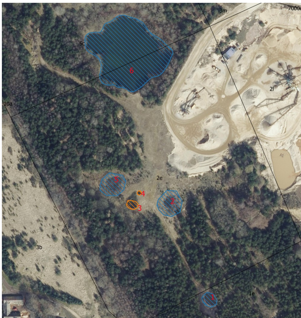
Billede 2: Oversigtskort. Blå og orange skraveringer viser de undersøgte søer/paddeskrab. Blå er § 3-beskyttet og orange er ikke. Søerne er nummereret 1-6, hvor nr. 6 er den tidligere gravesø.