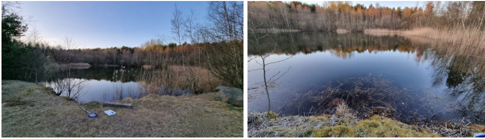
Billede 8: Undersøgelsesområde 6.