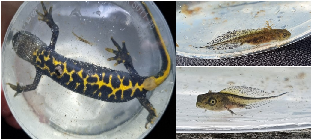
Billede 12: Voksen og larver af stor vandsalamander fundet i undersøgelsesområderne