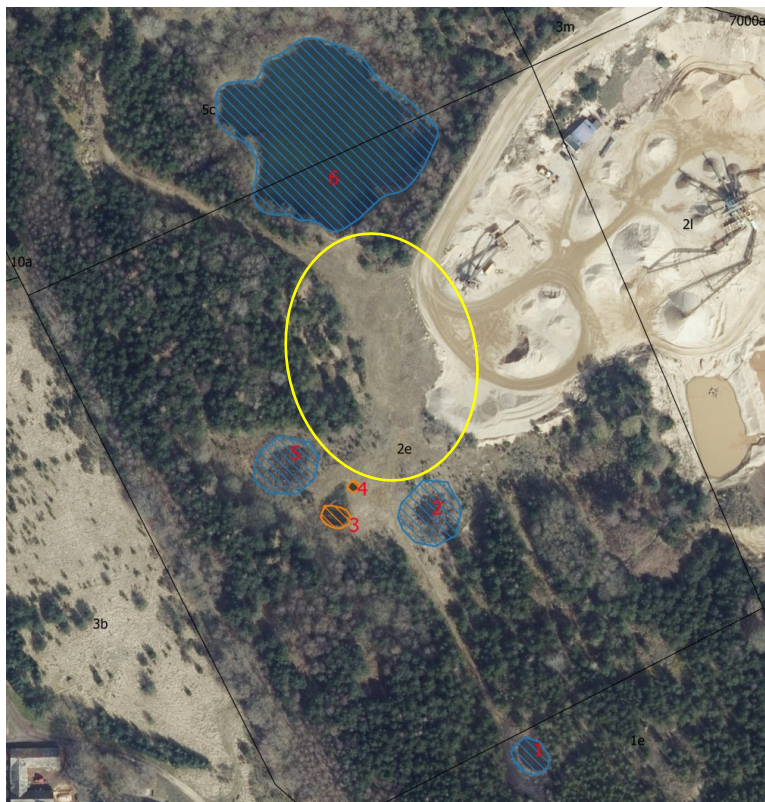
Billede 11: Områder, hvor der blev eftersøgt fouragerende strandtudser, er markeret med gul cirkel.

Der blev ikke fundet andre spor af strandtudse i nogen af undersøgelsesområderne. Området mellem undersøgelsesområderne blev også eftersøgt for fouragerende strandtudser på alle besigtigelsesdagene, men uden fund (Billede 11).