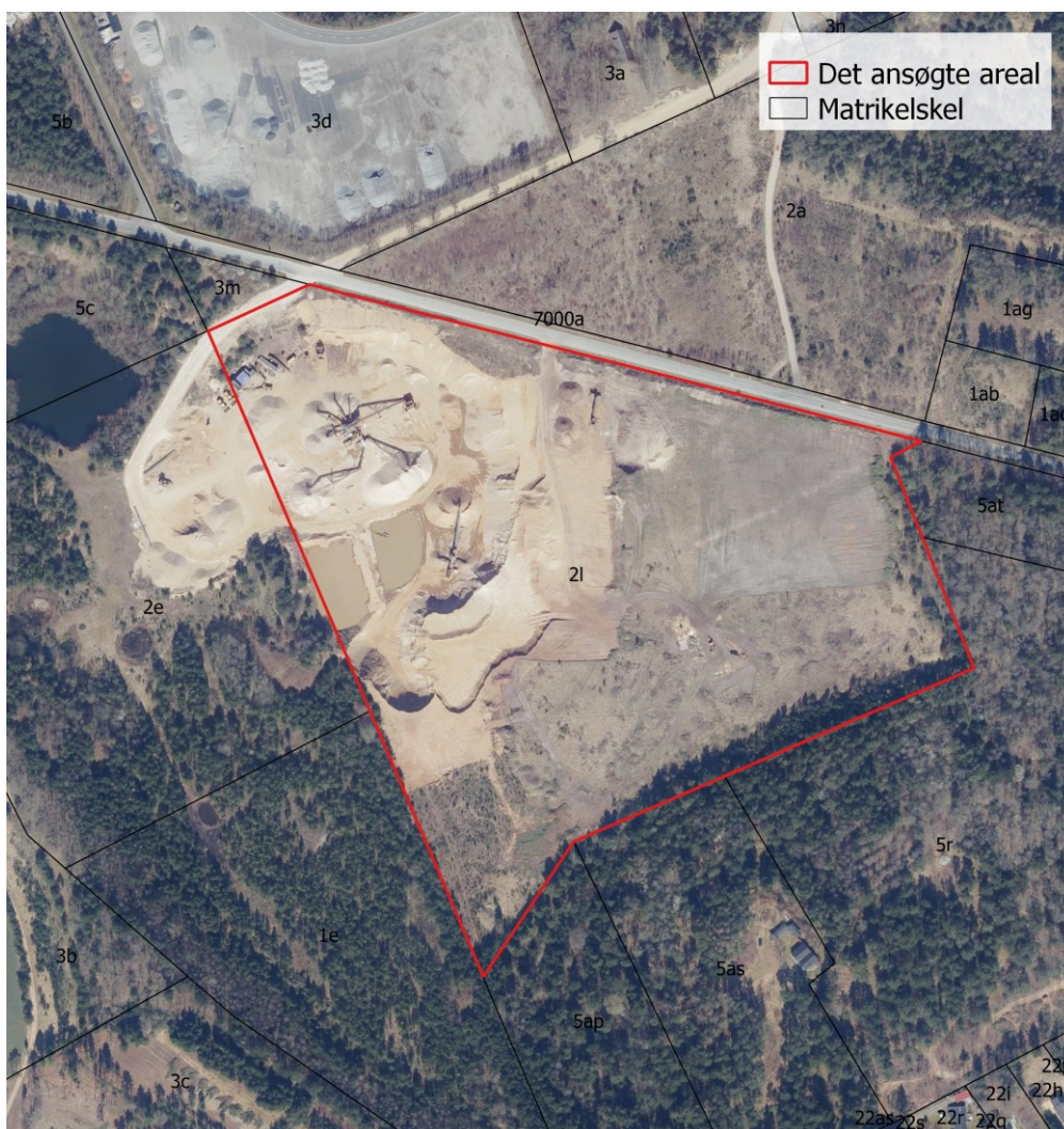
Ortofoto forår 2022, 1:3.000. Det ansøgte areal er omridset med rød streg, matrikelskel med sort.