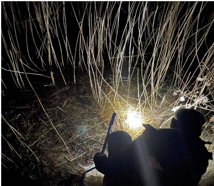
Billede 7: Undersøgelsesområde 5

§ 3-beskyttet padderok. Var under tilgroning af sivgræs i selve søen samt af birk, pil og fyr omkring søen. Søen var klarvandet og havde en dybde på max 0,7 m. Den var primært overskygget pga. skrånende terræn og bevoksning omkring søen (Billede 7, taget d. 21. april 2022).