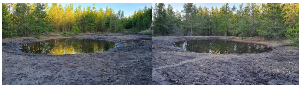
Billede 3: Undersøgelsesområde 1

§ 3-beskyttet paddeskrab. Der var ingen vegetation i søen eller langs søen kant. Søen er omgivet af nåleskov (Billede 3, taget d. 21. april 2022).