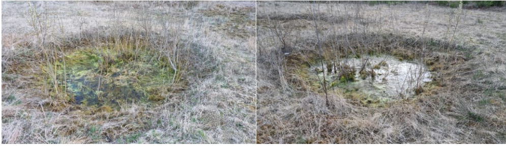
Billede 6: Undersøgelsesområde 4.