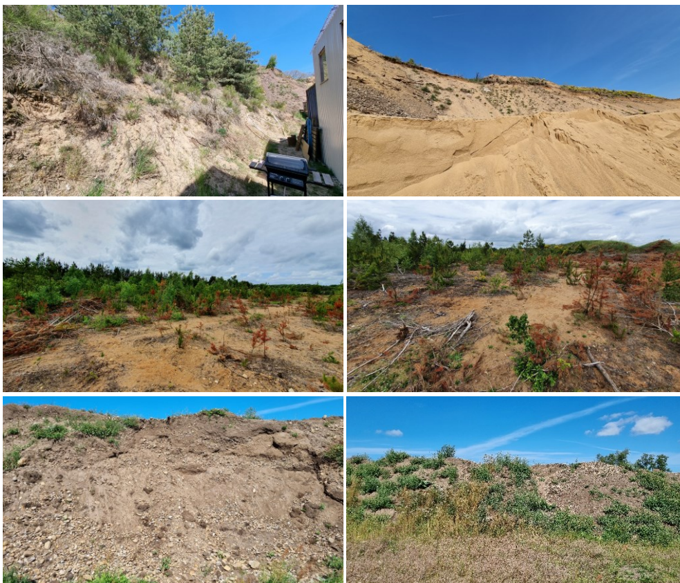
Billede 9: Eksempler på egnede levesteder for markfirben, der blev besøgt. Øverst ses egnede levesteder i den eksisterende grav i nederst ses egnede levesteder på de nye ansøgte arealer.

Da der er tale om en ny ansøgning i en eksisterende råstofgrav, udgør de bare sydvendte skrånninger i den eksisterende råstofgrav i sig selv et levested for markfirben. Derudover ansøges der også på nye områder, der indeholder egnede levestedsstrukturer for markfirben. Derfor blev den eksisterende grav og de ansøgte arealer eftersøgt for markfirben d. 9. maj, d. 12. juni og d. 1. august 2022 (Billede 9).