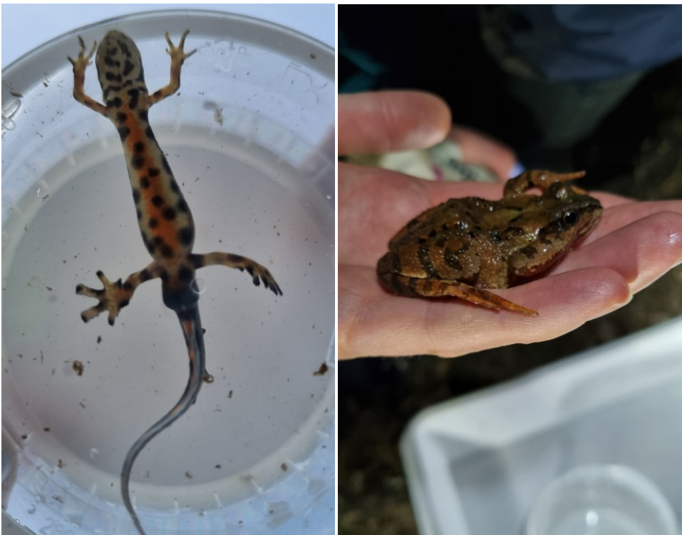
Billede 13: Lille vandsalamander (tv.) og butsnudet frø (th.)

Der blev registreret lille vandsalamander og skrubtudse i undersøgelsesområde 2, 3, 5 og 6. Der blev desuden registreret skrubtudseæg i undersøgelsesområde 4 d. 21. april. I undersøgelsesområde 6 blev der d. 21. april også hørt kvækkende butsnudet frø samt fundet et enkelt eksemplar af samme art på arealet mellem undersøgelsesområderne (Billede 13).