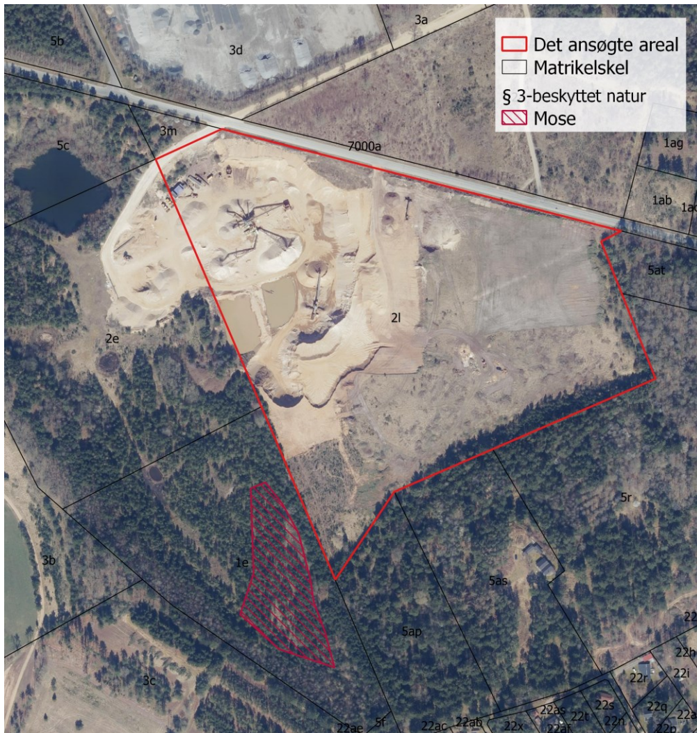
Billede 1: § 3-beskyttet mose sydvest for det ansøgte areal.

Langs det ansøgte areal mod vest er der en § 3-beskyttet mose (Billede 1)