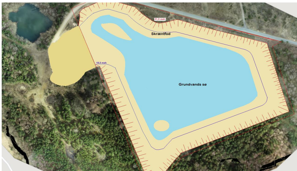
Billede 15: Forslag til efterbehandlingsplan fra ansøgningsmaterialet

I vurderingen af projektets påvirkning på yngle-/rasteområder for strandtudse, tages der særligt udgangspunkt i områdets økologiske funktionalitet, som det beskrives i vejledningen til habitatbekendtgørelsen 9 . Her fremgår det, at det er mere hensigtsmæssigt at betragte økologisk sammenhængende yngle- og rasteområder som et "samlet" område for arten frem for isoleret set at vurdere de enkelte lokaliteter. Det giver mulighed for at håndtere strandtudsens mere fleksibelt, da det handler om at opretholde en vedvarende økologisk funktionalitet af det samlede område uden at det tilsidesætter beskyttelseshensynet. Da princippet således er baseret på en bredere økologisk forståelse for arten og dens levevis, er dette særlig relevant i forhold til strandtudsens, hvis yngle-/rasteområder er afhængig af forstyrrelse og variation.