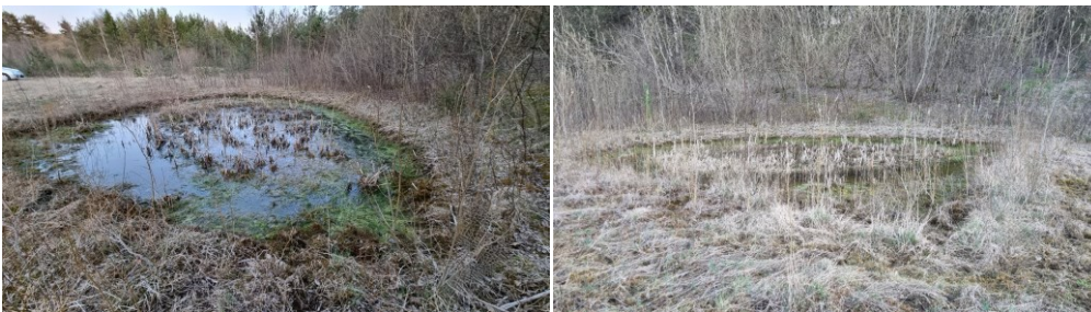
Billede 5: Undersøgelsesområde 3.

Ikke § 3-beskyttet paddeskrab. Var under tilgroning af siv. Søen var max 30-40 cm dyb, klarvandet og med fin undervandsvegetation. Vandstanden fluktuerede meget over forårssæsonen (Billede 5, taget d. 21. april 2022)