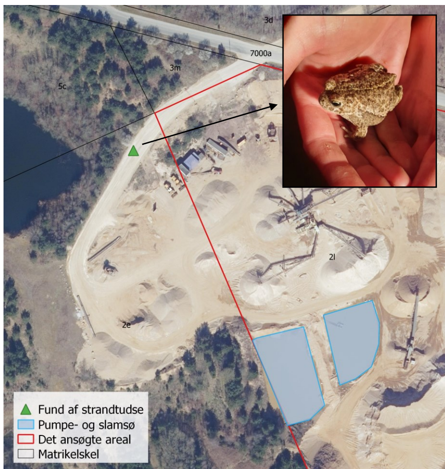
Billede 10: Eftersøgning af strandtudse ved pumpe- og slamsø samt fund af strandtudse på adgangsvej.

Ved undersøgelse af arealet blev en voksen strandtudse fundet på adgangsvejen til graven (Billede 10).