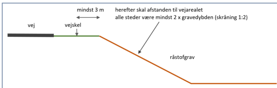
Figur 3: Principskitse for udgravning nær offentlig vej og privat fællesvej uden særskilt tilladelse fra vejmyndigheden.

Jf. vejlovens § 73 stk. 3 kræver det vejmyndighedens tilladelse at foretage udgravning eller påfyldning nærmere vejens areal end 3 m samt nærmere vejens areal end svarende til to gange højdeforskellen mellem udgravningen eller påfyldningen og vejens areal. Dette finder tilsvarende anvendelse ved udgravning og opfyldning på og ved private fællesveje. Se nedenstående principskitser.