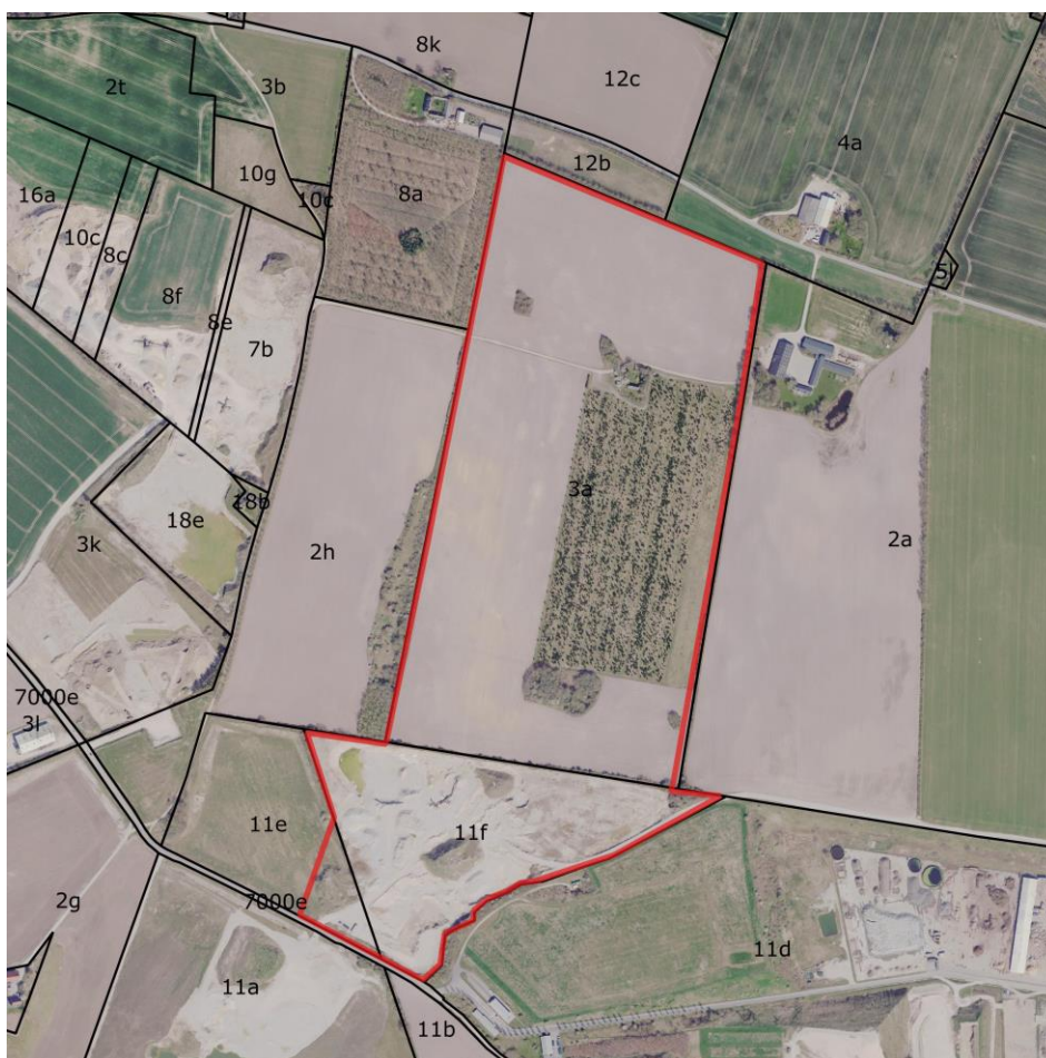
Figur 1: Kortudsnit viser det tilladte areal til råstofindvinding (rød) på luftfoto fra forår 2023 i 1:7.000. Matrikelskel og -nr. er vist med sort.