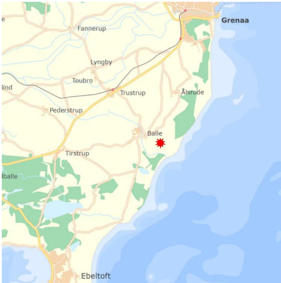
Figur 2: Kortudsnittet viser placering af det tilladte areal til råstofindvinding (rød stjerne) mellem Grenaa mod nord og Ebeltoft mod syd. Skala: 1:120.000.