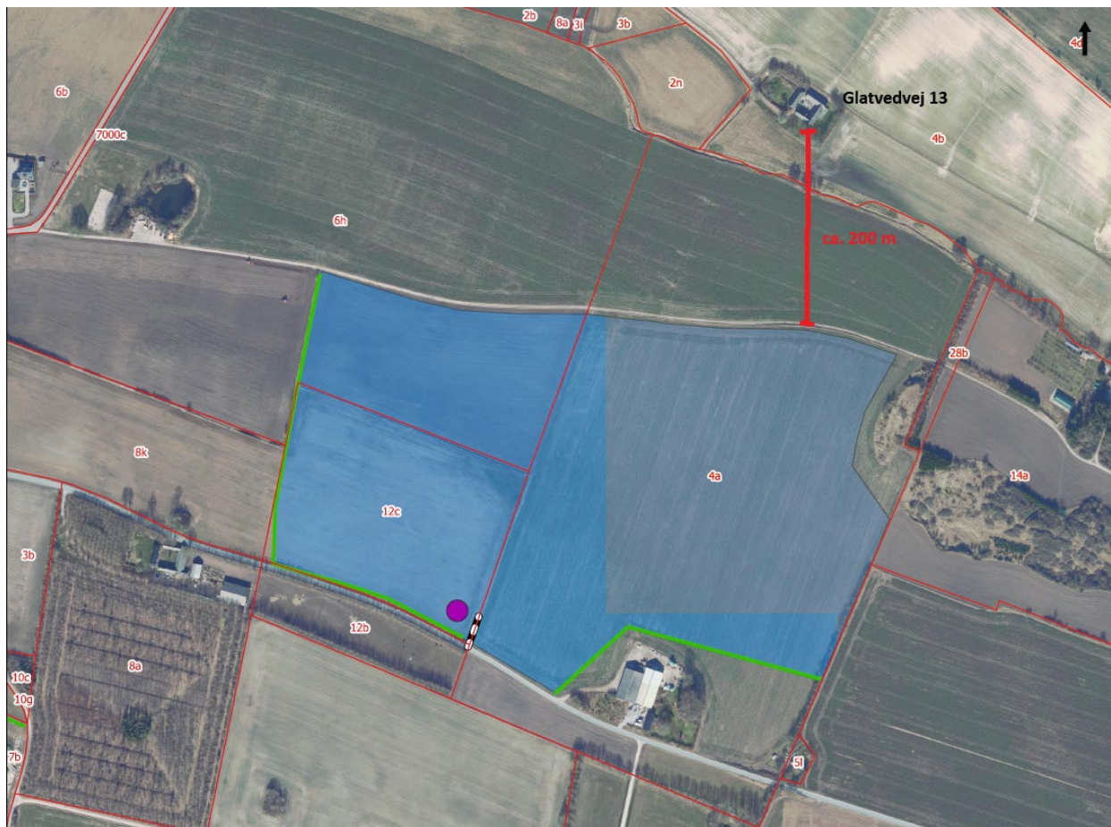
Figur 1: Oversigt over ejendommens placering.