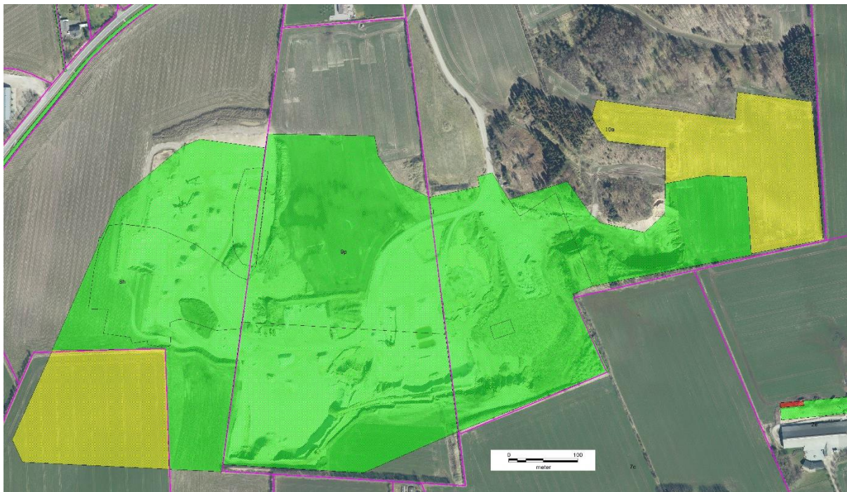
1 Frivgne arealer markeret med grønt og områder der ikke er undersøgt med gult på baggrund af luftfoto fra 2023.