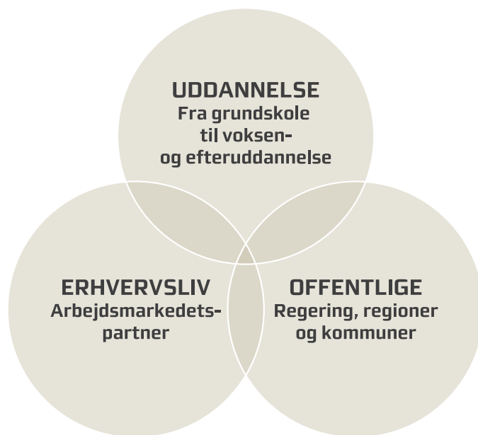
Figur 1: Partnerskabet for fremmedsprog i Region Midtjylland

Som en del af Den Midtjyske Strategi for Fremmedsprog gøres Det Midtjyske Sprogudvalg permanent som et operationelt partnerskab, hvor strategiens fremdrift vil blive fulgt og evalueret. Sprogudvalget består af repræsentanter fra både uddannelsessystemet, erhvervslivet og offentlige organisationer, hvorfor det er en essentiel aktør i det fremtidige arbejde med fremmedsprogene. Partnerskabet vil skabe sammenhæng til den nationale sprogstrategi og samtidig binde de politiske aktører, erhvervslivet og uddannelsesinstitutionerne tættere sammen, jf. figur 1.